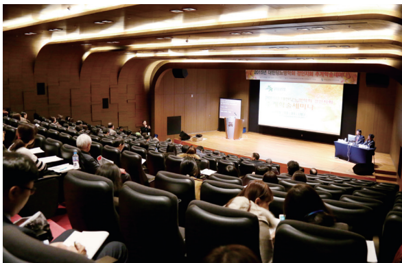
2015년 경인지회 추계학술세미나

경인지회는 2002년 창립 심포지엄, SDM, 개원의 연수 강좌, 임원진 세미나 등을 개최한 이후 해마다 크고 작은 워크숍 및 학술 세미나를 개최해 왔다. 2003년과 2004년에 당뇨병 교육자 세미나를 개최하였고, 전체 경인지역의 의사, 간호사, 영양사, 사회복지