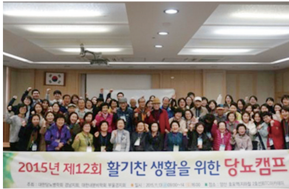
2015년 부산울산경남지회 활기찬 생활을 위한 당뇨캠프