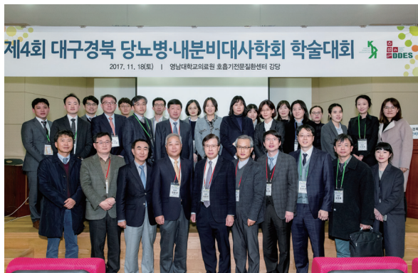
2017년 대구경북 당뇨병내분비대사학회 학술대회