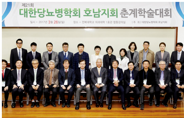
2017년 호남지회 춘계학술대회