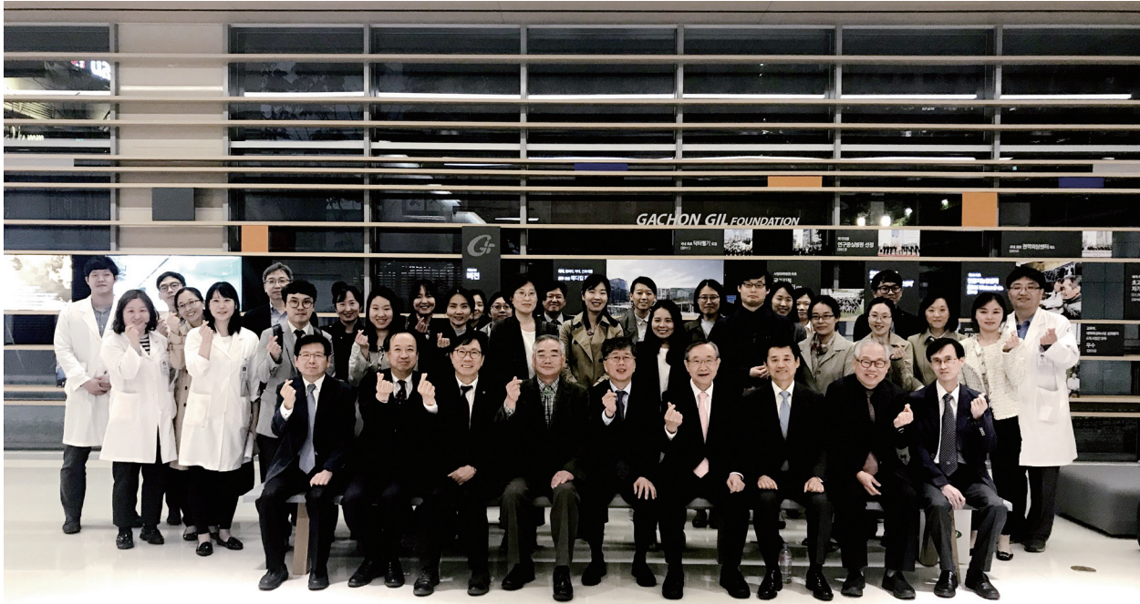
2018년 경인지회 춘계집담회

사가 참여하는 가운데 매년 춘계 워크숍과 추계 학술 세미나를 개최하고 있다. 또한 2002년 이후 매년 SDM을 경인 각 지역을 순회하며 열고 있다. 2002년 5월 25일 경인지역 제1차 SDM이 개최되었고 이후 매년 3~4차례 정기적으로 개최되었다. 한편, 각 분회(경기북부, 경기남부, 경기서부)별로 1년에 4~5차례 모임을 개최, 소규모 학술 토론 및 정보 교환의 장을 마련하고 있다. 이러한 모임을 통하여 분회별로 공동 연구를 진행한 바 있다.