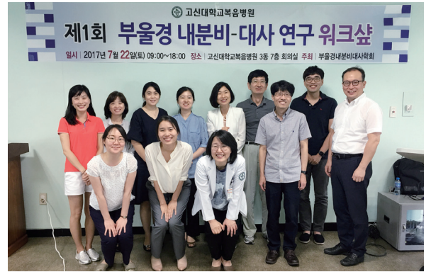
2017년 부산울산경남지회 내분비-대사 연구 워크숍

를 시작하여 초기에는 1~2년 간격으로 시행하다가, 2004년 이후에는 매년 1박 2일의 성인 당뇨캠프를 정기적으로 개최하고 있고, 2018년 11월에는 제15회 부산 활기찬 생활을 위한 당뇨캠프를 앞두고 있다.