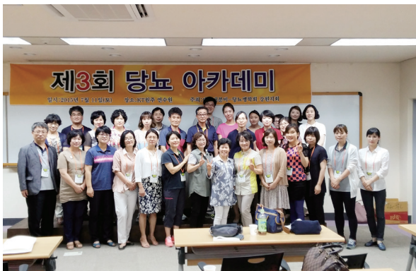
2015년 강원지회 당뇨아카데미