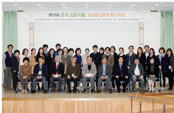
2015년 충청지회 제15회 춘계심포지움